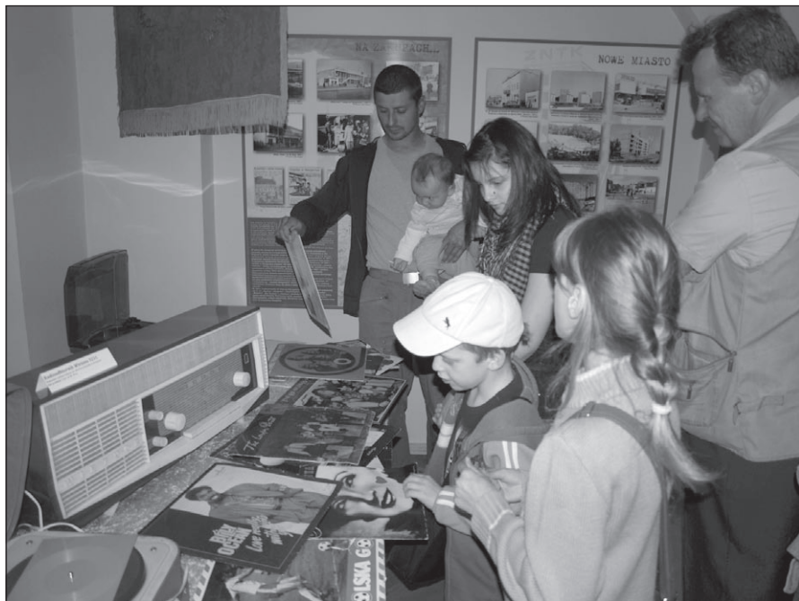
Ilustr. 5. Noc Muzeów 2011.