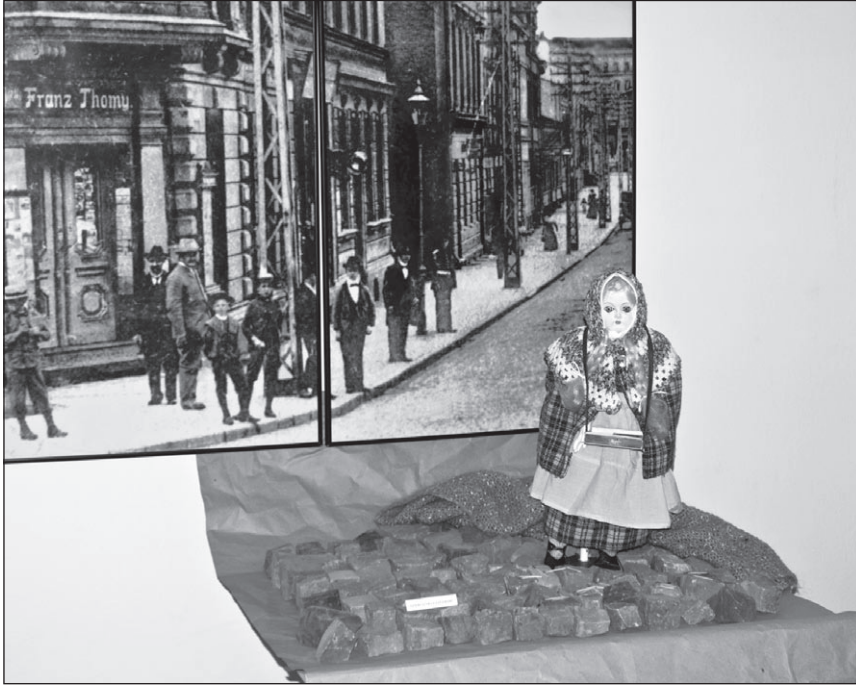
Ilustr. 7. Wystawa Domek z bajki .