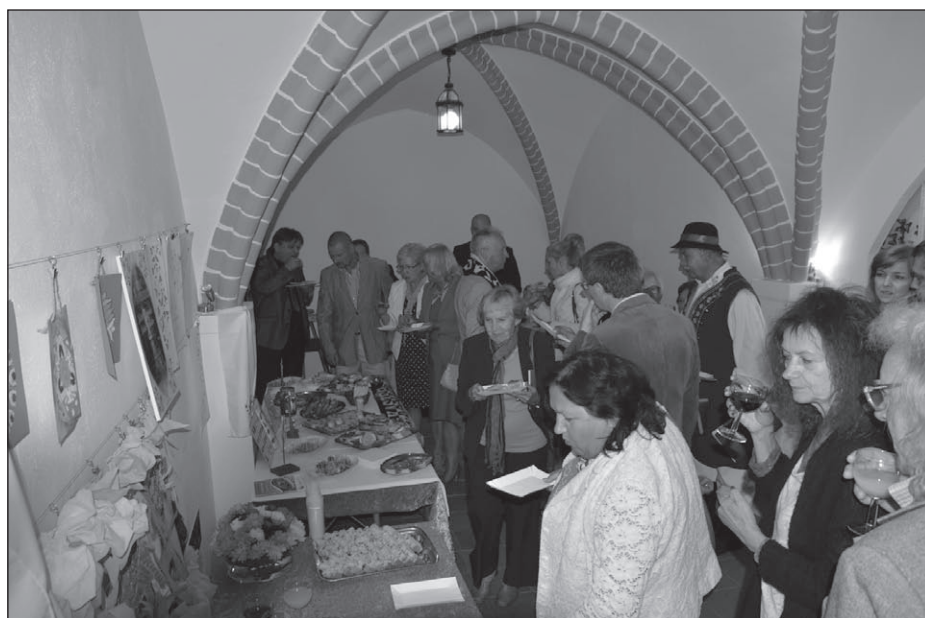
Ilustr. 10. Wernisaż wystawy Z kaszubsko-słowiańskich i polskich losów Pomorza Zachodniego .