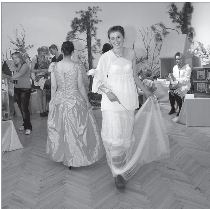
Ilustr. 3. Noc Muzeów 2011.