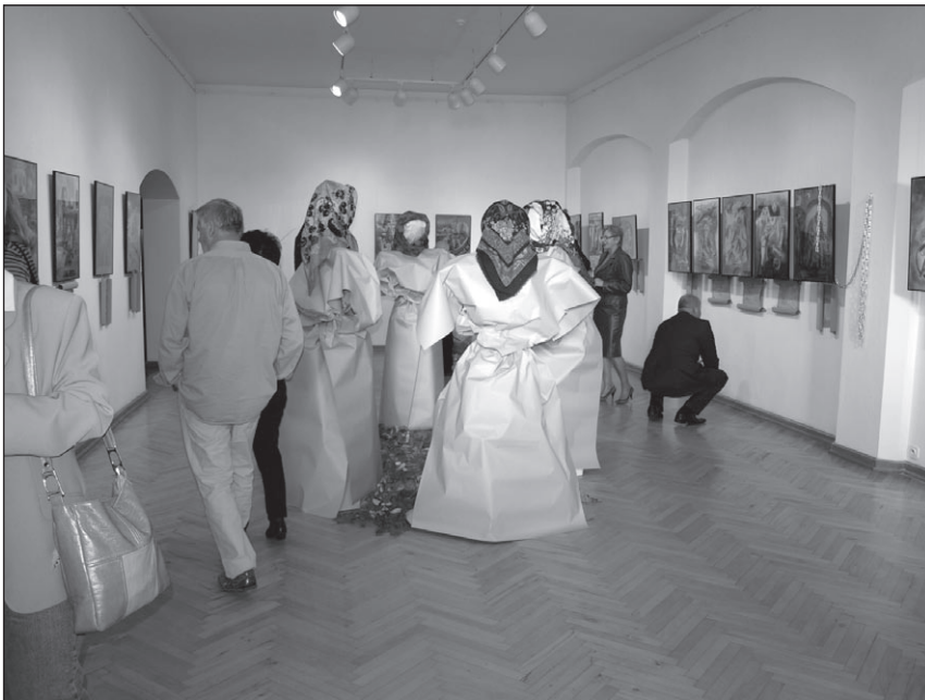
Ilustr. 8. Wystawa Legendy pomorskie .