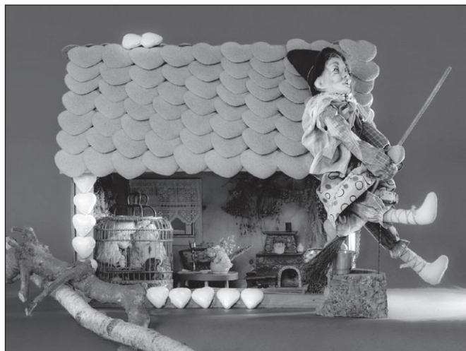
Ilustr. 1. Wystawa Domek z bajki .