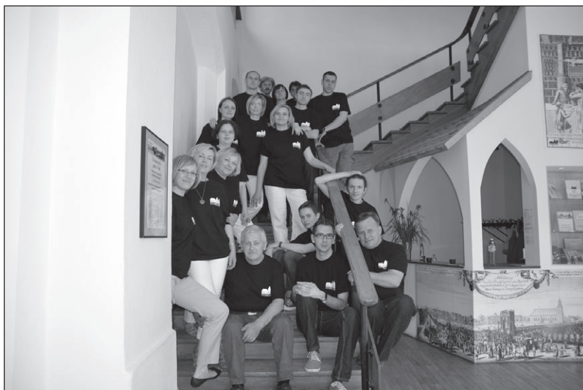
Ilustr. 14. Noc Muzeów 2012.