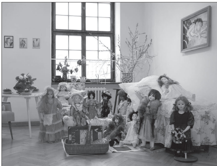
Ilustr. 6. Wystawa Domek z bajki .