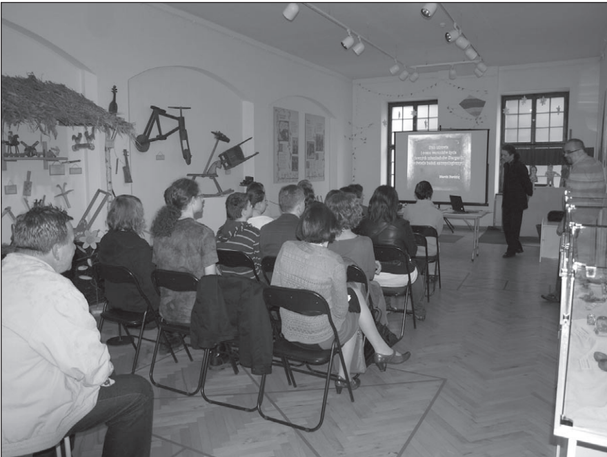
Ilustr. 12. Prelekcja z cyklu „Muzealnych Spotkań z Przeszłością”.