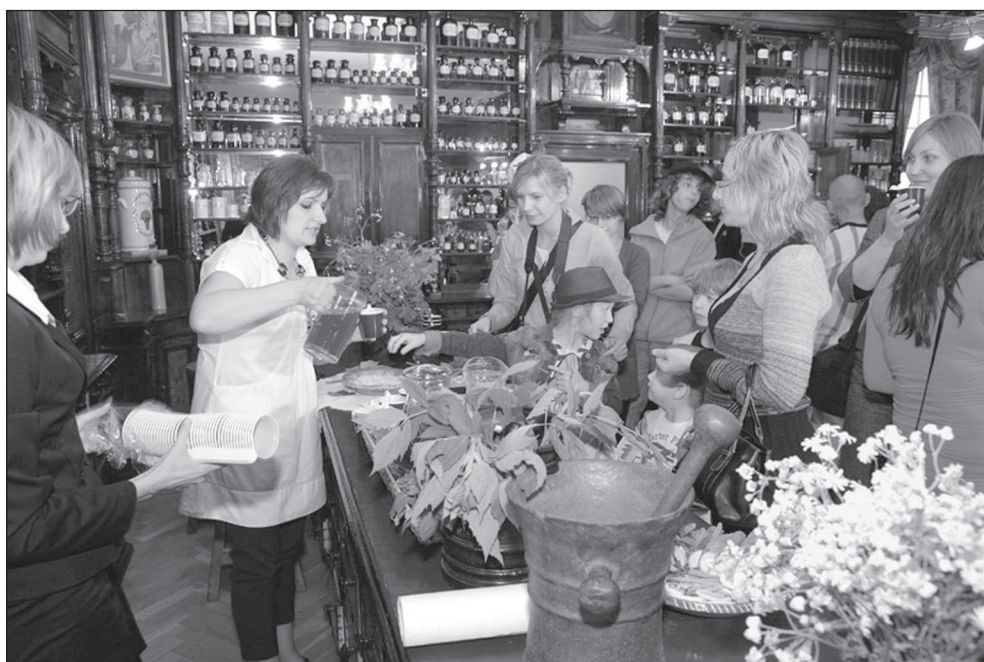
Ilustr. 4. Noc Muzeów 2011.