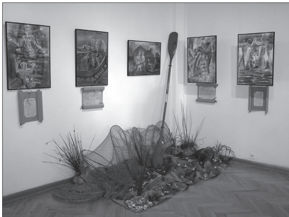
Ilustr. 9. Wystawa Legandy pomorskie .