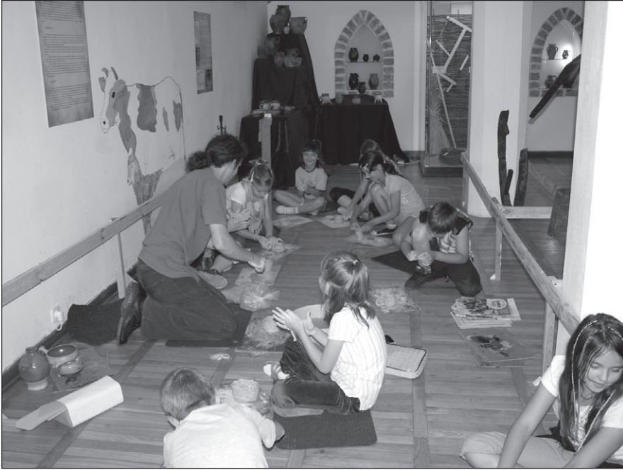
Ilustr. 11. Zajęcia wakacyjne z Podstaw garncarstwa .