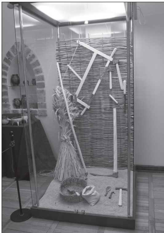
Ilustr. 13. Wystawa Zatrzymane w czasie. Najważniejsze odkrycia archeologiczne ostatniego dziesięciolecia .